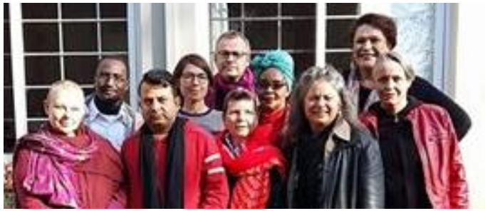
Algunos de nuestros miembros de la Junta y el personal en la primera reunión de la Junta