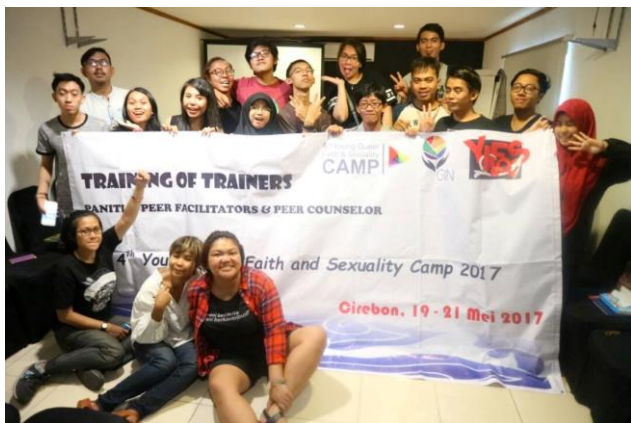
Campamento juvenil, YIFOS, Indonesia, sudeste asiático

Los proyectos que se implementaron pero que no requirieron financiamiento incluyeron trabajo de: