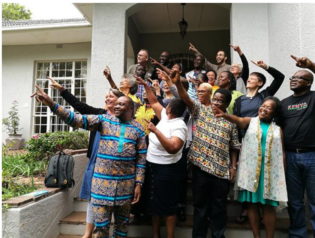
Participantes en el Seminario de Familia y Valores Tradicionales, febrero de 2018, Johannesburgo

En 2017/8, GIN sentó las bases para una serie de seminarios sobre “Fe, familia y valores tradicionales”, seminarios regionales que reúnen a activistas, académicos y defensores de los derechos humanos para desarrollar narrativas contrarias que están ubicadas a nivel regional y contextual y que a su vez El objetivo es educar y reforzar las estrategias formales de derechos humanos existentes y las campañas locales.